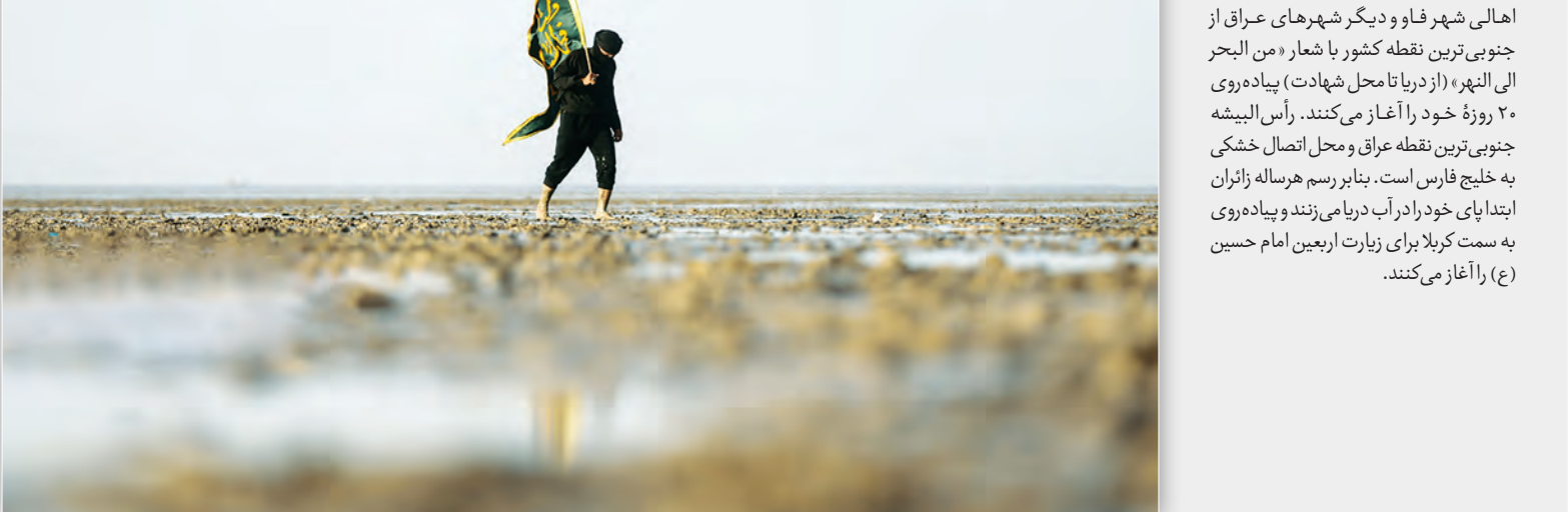
عکس از فروردین‌ماه ۱۳۷۰

علامه روضاتی، کتابخانه‌ای در اصفهان داشت که به دلیل وجود نسخه‌های خطی و چاپی نفیس، شهرت داشته و بخشی از کتاب‌های موجود در آن، میراث خاندان روضاتی بود. روضاتی صبح پنج‌شنبه ۲۹ تیر سال ۱۳۹۱ شمسی در منزل خود در محله چهارسوی (چهارسوق) شیرازی‌ها درگذشت و پس آن در تخت فولاد در بقعه میرزا محمدباقر خوانساری صاحب کتاب روضات الجنات دفن شد.