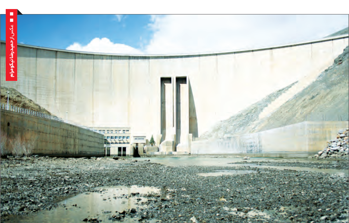
عکس از حوض رضا تکیو مرام

به گفته سخن‌گوی صنعت آب، شهر اصفهان در پیشانی تنش آبی قرار دارد