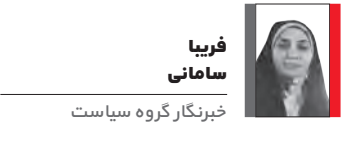
خبرنگار گروه سیاست

درحالی‌که برخی از مناطق کشاورز جمله استان اصفهان با خشکسالی گسترده، کاهش منابع آبی و افت شدید برداشت محصول روبه‌روست، تاخیر در پرداخت مطالبات گندم‌کاران به یکی از اصلی‌ترین چالش‌های معیشتی کشاورزان تبدیل شده است. این شرایط که استمرار آن، نه‌تنها سفره کشاورزان را کوچک‌تر کرده، بلکه نگرانی‌هایی درباره امنیت غذایی کشور را نیز به وجود آورده است، حالا ما با خروجی جلسه روزیکشنیه کمیسیون کشاورزی مجلس با حضور وزیر جهاد کشاورزی، رئیس سازمان برنامه و بودجه و رئیس بانک مرکزی مبنی بر پرداخت ۵۰ هزار میلیارد تومان از مطالبات گندم‌کاران تا ۹ روز آینده، به نظر می‌آید تا حدودی دغدغه گندمکاران در این رابطه برطرف شود. مبلغی که قرار است به گندمکاران طی روزهای آینده پرداخت شود بابت