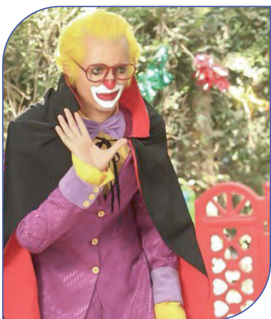
شیمافرغی خبرنگار نوجوان

نقد و بررسی فیلم «شهر آرزوها» به کارگردانی محمدتین اوجانی