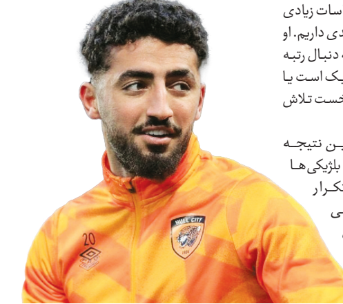
صیادمنش در جریان دیدار تیم ملی فوتبال ایران در مقابل بلژیک

من به‌عنوان یک پسر جوان، رؤیای جام جهانی