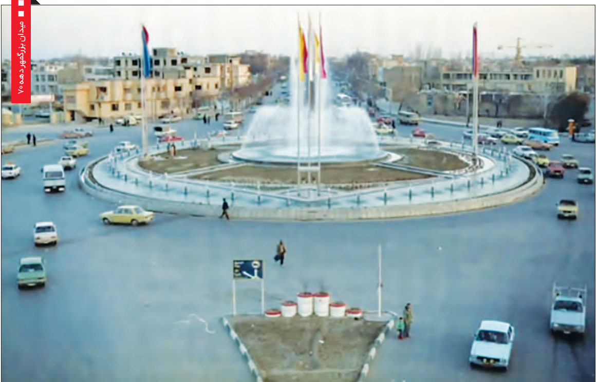
میدان بزرگ شهر دهه ۷۰

چه اتفاقاتی در شهر اصفهان در دهه ۷۰ و مدیریت شهری آن دوران رخ داد؟