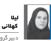
دبیر گروه سلامت

این روش انرژی بدن را افزایش می‌دهد، خستگی را کاهش می‌دهد و کیفیت زندگی را بهبود می‌بخشد. با رعایت اصول طب سنتی اسلامی در رژیم غذایی و پاک‌سازی کبد، افراد می‌توانند سلامت جسم و روان خود را همزمان تقویت کنند. پاک‌سازی طبیعی و علمی کبد، جایگزینی مناسب برای درمان‌های صرفاً دارویی است و پایه‌ای قوی برای سبک زندگی سالم فراهم می‌آورد. این روش با ایجاد تعادل در طبع بدن، تقویت ارگان‌ها و پیشگیری از بیماری‌های مزمن، کیفیت زندگی و طول عمر را افزایش می‌دهد.