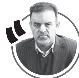
رضا برزوثیان، مدیرکل اداره کار، تعاون و رفاه اجتماعی استان اصفهان

از ابتدای اجرای طرح، کمیته نظارت مشترکی با حضور نمایندگان تعزیرات حکومتی، صمت، بازرسی اصناف و استانداری تشکیل داده ایم؛ همچنین دستورالعمل تخلف‌ها به اتحادیه‌ها و دستگاه‌های مرتبط ابلاغ شده است. اجبار مشتری به خرید از کل اعتبار ماهیانه (با وجود امکان خرید تدریجی)، اجبار به خرید برند خاص، دریافت کارمزد اضافی، عدم صدور فاکتور، گران‌فروشی، کم‌فروشی و عرضه کالای تاریخ مصرف گذشته، از جمله مواردی است که تعریف شده و با آن برخورد قاطع صورت می‌گیرد. اخیراً سامانه ۲۸۰ فروشگاه که در خصوص عملکرد آن‌ها شائبه تخلف وجود داشت، قطع شد. پس از مراجعه این واحدها، بررسی موارد و دریافت تعهد، مجدداً ترمینال‌های آن‌ها فعال شده است. این اقدام نشان می‌دهد که نظارت صرفاً شعاری نیست و به صورت عملی دنبال می‌شود