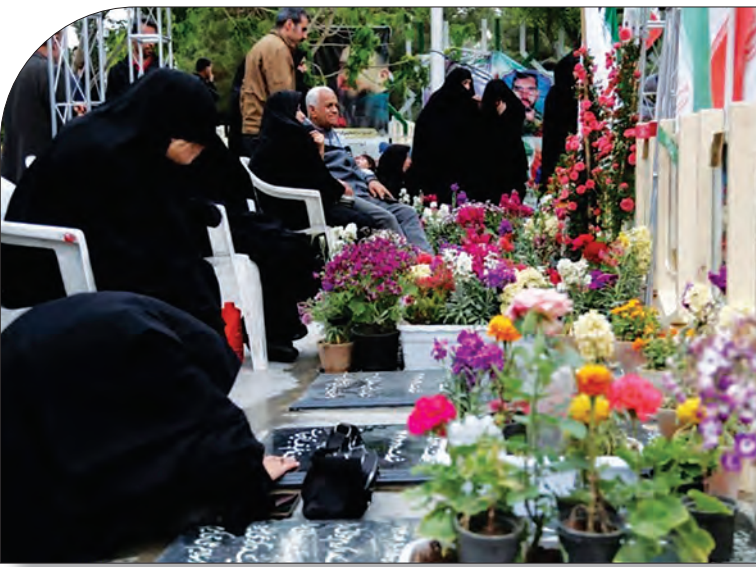
بسیار گلزار شهدای اصفهان در روزهای اخیر رونق گرفته است.

هرخاکی زنده نیست و زنده نمی ماند جاهایی از زمین، روی خاک ها گرد مرده پاشیده اند. جاهایی اما خاک ها زنده اند و زندگی شان را از زنده ها می گیرند. زنده ها این که خوششان روی زمین ریخت و حیات را جاودانه کرد. گلستان شهدا این روزها از همیشه زنده تر است. زنده به خون شهیدانی تازه نفس و تازه از راه سیده که میزبان شان شده و حیات جاودانه شان را به کل شهر تزیین می کند. در صفحه روایت شهر، روایت هایی را می خوانیم از فصل تازه گلستان شهدای اصفهان.