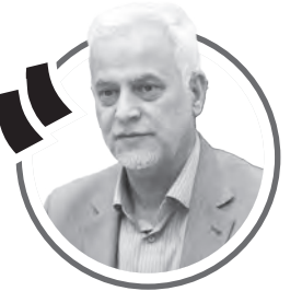
دکتر علی قاسمزاده، شهردار اصفهان

حدود ۹۰ درصد منازل آسیب دیده جنگ رمضان نیاز به مرمت جزئی دارد که در نهایت تا دو هفته زمان بر بوده و بخش چشمگیری از مرمت ها آغاز شده است بخشی از خانه ها که تخریب جدی داشته است، باید از نوساخته شود که بین شش ماه تا دو سال به طول می انجامد و برای مرمت باید ساکنان را در منازل دیگر اسکان دهیم. شهرداری اصفهان پیگیر است تا برای این افراد منزلی رهن کند؛ اما ممکن است به کمک مردم نیز از حیث معنوی و مادی نیاز داشته باشیم تا مقداری بار از دوش شهر برداشته شود