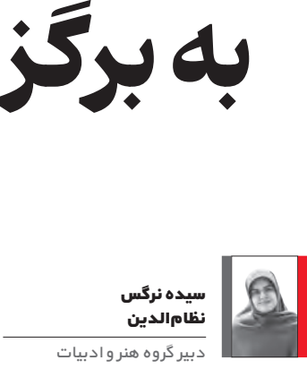
سیده نرگس نظام‌الدین