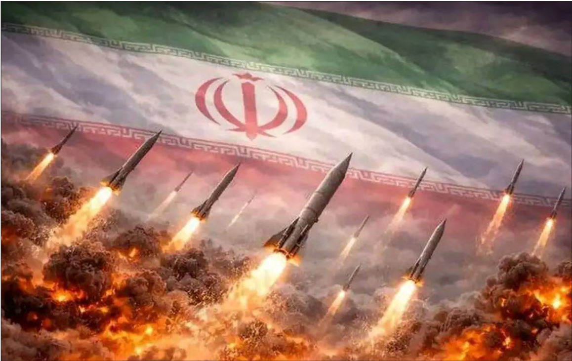
موشک‌های ایرانی در حال پرتاب

بانقض آتش بس از سوی رژیم صهیونیستی، ایران بر اساس اصل وحدت ساحات، سرزمین‌های اشغالی را مورد هدف قرار داد. کارشناسان برای «اصفهان زیبا» توضیح دادند چرا اقدام متقابل ایران در برابر نقض آتش بس، ضروری وهوشمندانه بود؟