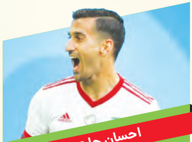
احسان حاج صفی

چند ماه قبل تصور اینکه حاج صفی یک بار دیگر در ترکیب تیم ملی فوتبال برای جام جهانی قرار بگیرد، دور از ذهن بود، اما با اعتماد دوباره قلمه نویسی به این بازیکن چپ پا، رکورد جاودانه چهار جام جهانی متوالی را ثبت کرد. حاج صفی در هر ۲ دوره حضور در جام جهانی در تمام بازی‌های تیم ملی بازی کرده و با ۹ بازی در جام جهانی در نیمه از دیدارهای ایران در تاریخ این رقابت‌ها به میدان رفته است. حاج صفی به همراه جهانپخش با تجربه‌ترین بازیکنان تیم ملی فوتبال ایران محسوب می‌شوند و می‌توانند به کار سرمربی تیم ملی بیایند.