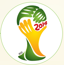
جام جهانی برزیل ۲۰۱۴

این بازیکن چپ پا که از همان ستین کم نبوغ فوتبالی اش را نشان داده بود، پس از درخشش در کاشان، جذب آکادمی ذوب آهن شد، اما در رده جوانان راهی تیم سپاهان شد و به واسطه ریسک‌پذیری بالای لوکا بوناچیچ پدیده‌ای به فوتبال ایران معرفی شد که هنوز هم یکی از بازیکنان قابل اتکاست. حاج صفی که در تمام رده‌های ملی سابقه بازی دارد، برای جام جهانی برزیل نظر مساعد کارلوس کی‌روش پرتغالی را جلب کرد و در لیست اعزامی جای گرفت، اما کار بزرگ او به جایی برمی‌گردد که بالاخره طلسم بازی نکردن اصفهانی‌ها در جام جهانی را شکست و در هر سه دیدار تیم ملی در مرحله گروهی نیز به میدان رفت.