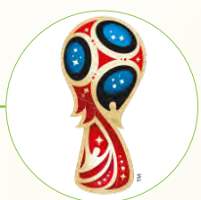
جام جهانی روسیه ۲۰۱۸