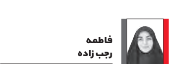
دبیر صفحه کانون‌ها